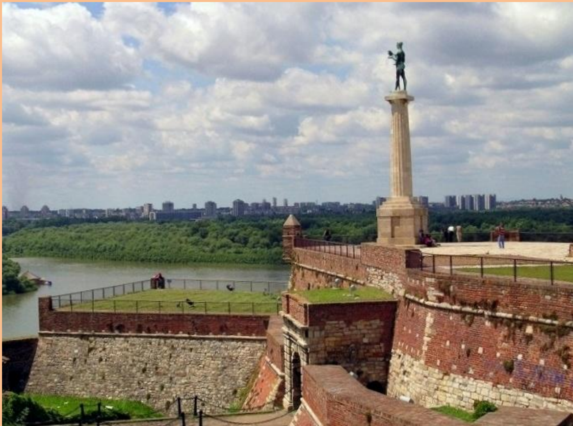
Beograd, Kalemegdan – Pobjednik

POKROVITELJ ŠKOLE MINISTARSTVO ZA ZDRAVLJE REPUBLIKE SRBIJE