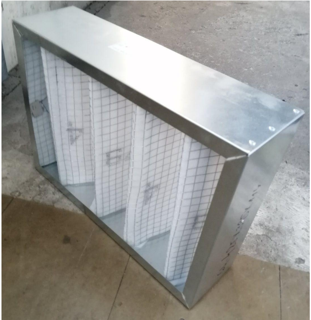
Комисија за јавну набавку М20-5